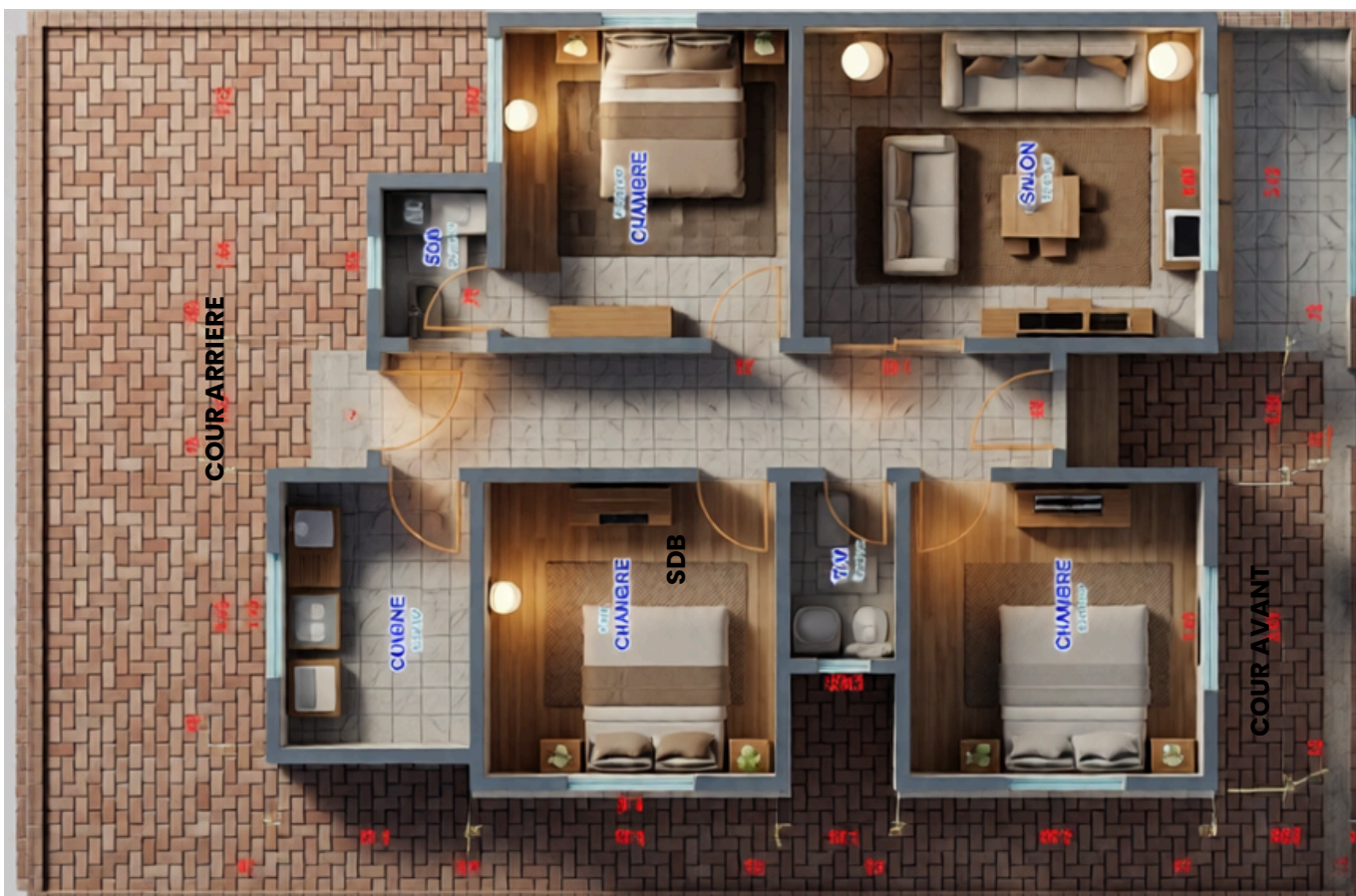
Rez de chaussée

Le logement idéal, ADAPTÉ AUX BESOINS DES FAMILLES MOYENNES