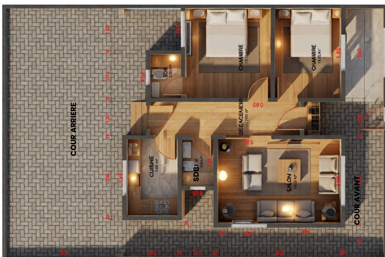
Rez de chaussée

Cette villa garantit un logement ACCESSIBLE, ADAPTÉ AUX BESOINS ESSENTIELS.