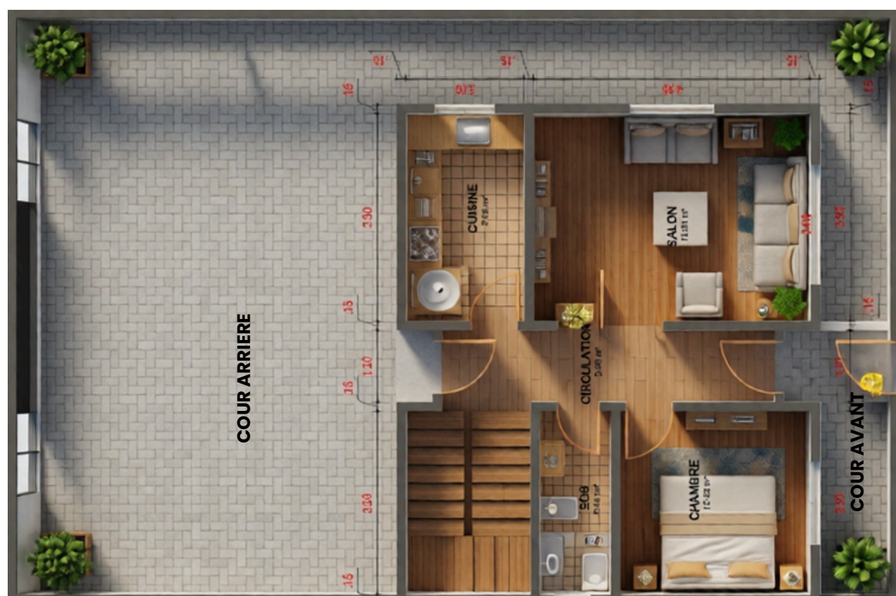
Rez de chaussée

Un espace lumineux OÙ CHAQUE FAMILLE TROUVE SA PLACE