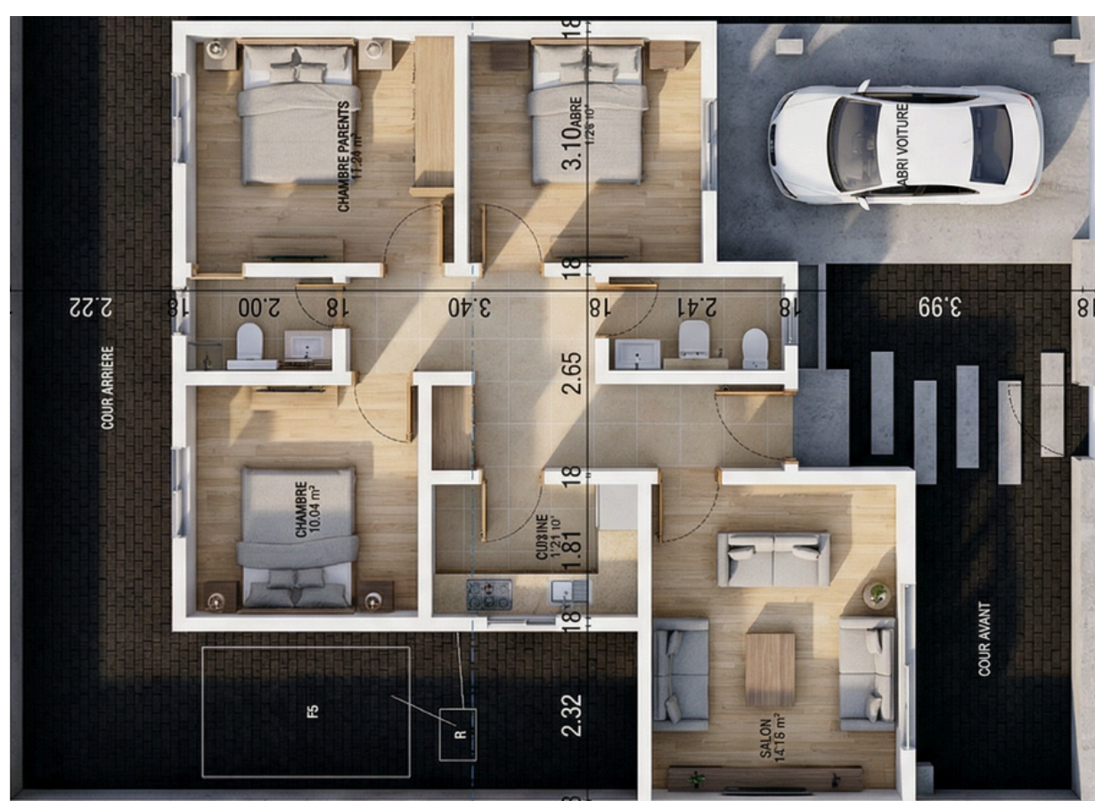
Rez de chaussée

Nos villas F4 offrent un cadre pratique et confortable, pensé pour le quotidien des familles. Simplicité et authenticité s'y conjuguent pour créer une atmosphère chaleureuse et accueillante. Avec des espaces fonctionnels, des chambres confortables, un salon convivial et une cuisine adaptée, elles répondent aux besoins essentiels de la vie familiale et favorisent des moments de partage au quotidien.