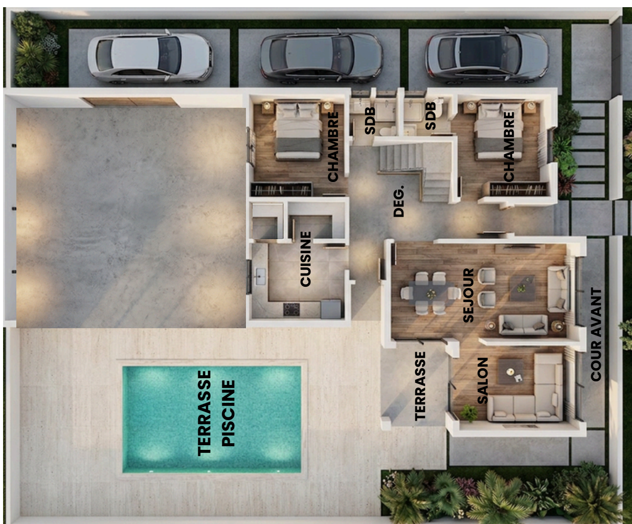
Rez de chaussée

Un espace lumineux ACCESSIBLE, CONÇU POUR OFFRIR CONFORT ET STABILITÉ AUX FAMILLES.