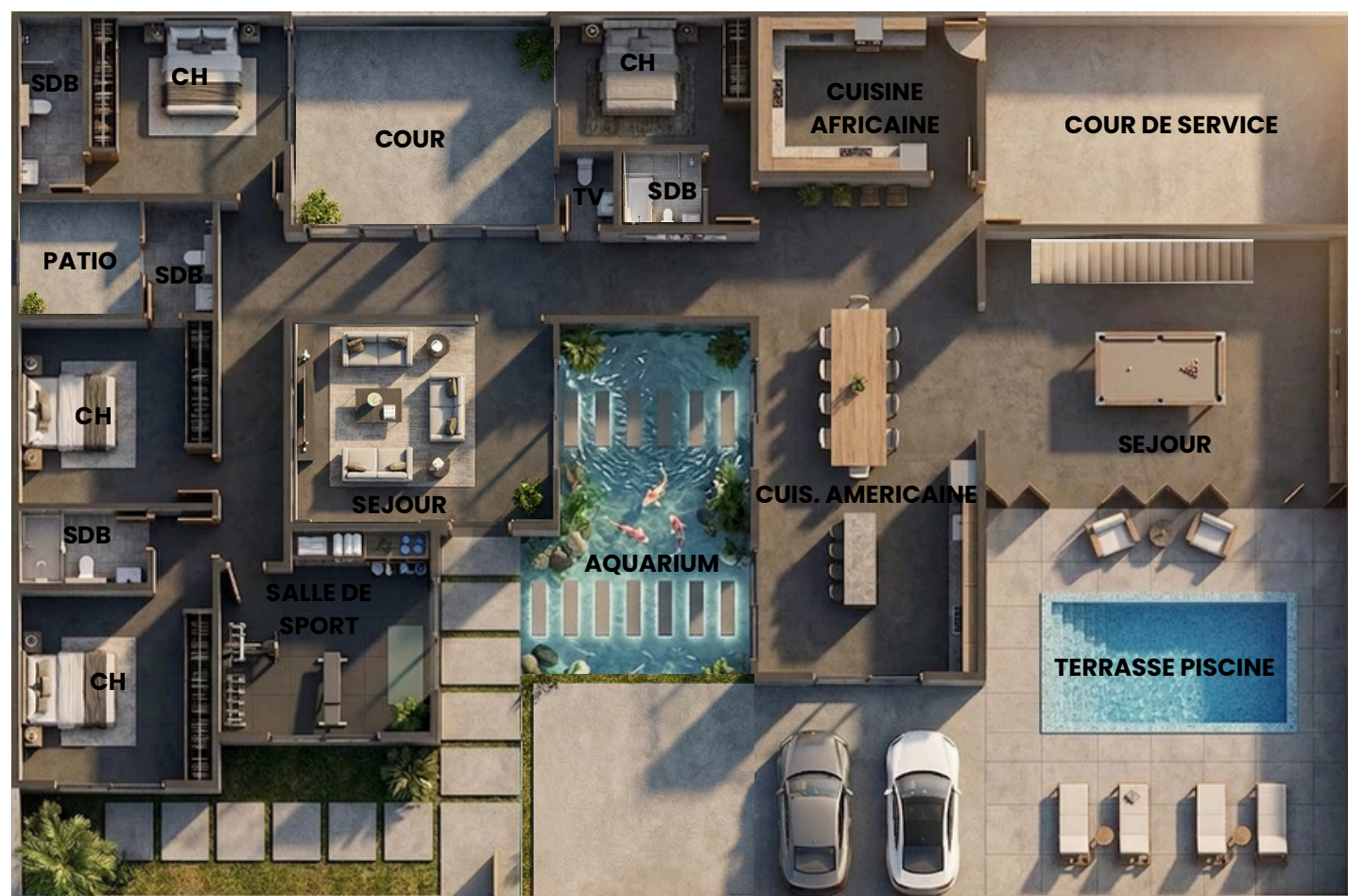
Rez de chaussée

Vivez l'expérience d'un séjour unique. Plongez dans l'élégance et la sérénité de nos villas, où chaque détail est conçu pour sublimer vos moments de détente. Entre design contemporain et charme local, elles offrent un cocon de luxe qui s'adapte à toutes vos envies.