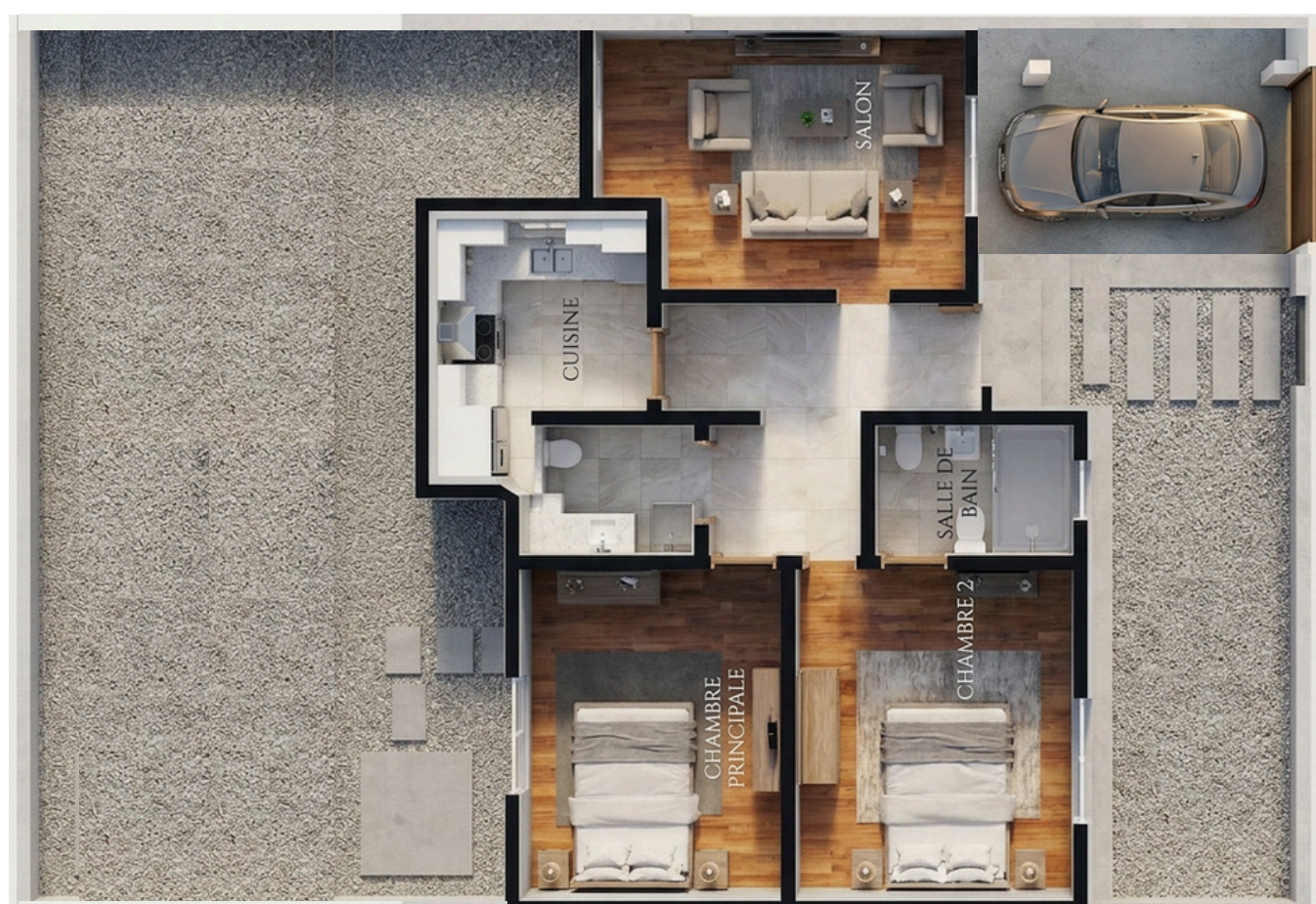
Rez de chaussée

Cette villa garantit un logement ACCESSIBLE, ADAPTÉ AUX BESOINS ESSENTIELS.