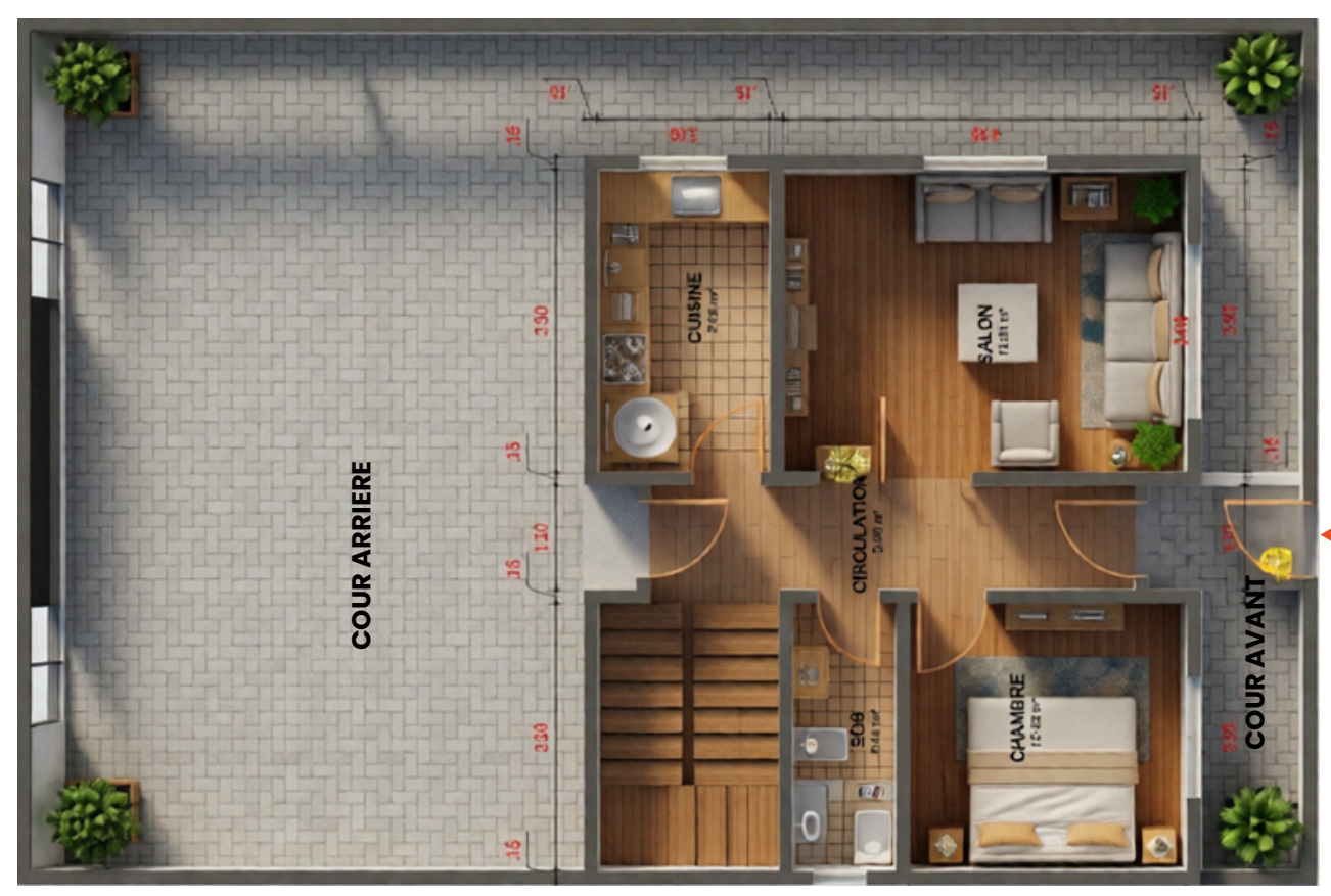
Rez de chaussée

Cette villa B2 allie modernité et praticité, avec des espaces lumineux et conviviaux. Au rez-de-chaussée, un séjour spacieux et une chambre fonctionnelle assurent confort et intimité. À l'étage, deux chambres agréables complètent une suite parentale avec salle de bain privative. La cuisine ergonomique et une toilette commune renforcent la praticité au quotidien. Un cadre harmonieux où chaque membre de la famille trouve sa place.